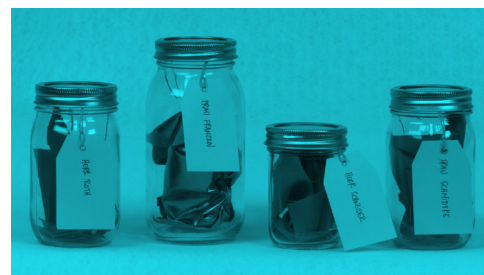
© Bambitchell, Special Works School (2018)

Depuis 2009, sous l'appellation Bambitchell, Sharlene Bamboat (1984) et Alexis Mitchell (1983) collaborent à la réalisation de projets artistiques fondés sur la recherche qui visent à réimaginer diverses histoires nationalistes par un recyclage souvent ludique de documents d'états et d'archives institutionnelles. Mercer Union (Toronto), la Gallery TPW (Toronto), articule (Montréal), la Art Gallery of Windsor et Images Festival