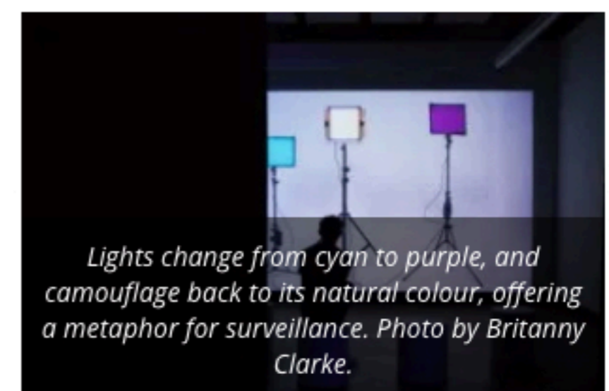
Lights change from cyan to purple, and camouflage back to its natural colour, offering a metaphor for surveillance.

Special Works School , New Pedestrians and Mikhail Karikis are on display at Dazibao, at 5455 de Gaspé Ave. suite 109, until Dec. 21. The gallery is open Tuesday to Saturday, from 12 p.m. to 5 p.m., and Thursday from 12 p.m. to 7 p.m.