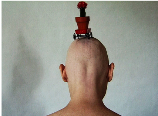
© Chantal duPont, Du front tout le tour de la tête (2000)

À travers sa pratique, comme professeure voire même mentor, Chantal duPont est de toutes les étapes du développement de la vidéo puis des arts numériques à Montréal, tant du côté des contenus que de l'émergence des réseaux de recherche et de diffusion. Elle contribue à de nombreux institutions, centres d'artistes et groupes de recherche tels que Vidéographe, le CIAM, Hexagram, La Centrale Galerie Powerhouse, Studio XX et Les rendez-vous du Cinéma québécois pour n'en nommer que quelques-uns. Membre fondatrice du Groupe de recherche en arts médiatiques, elle dirige le projet de recherche interuniversitaire « Nouvelles formes narratives et