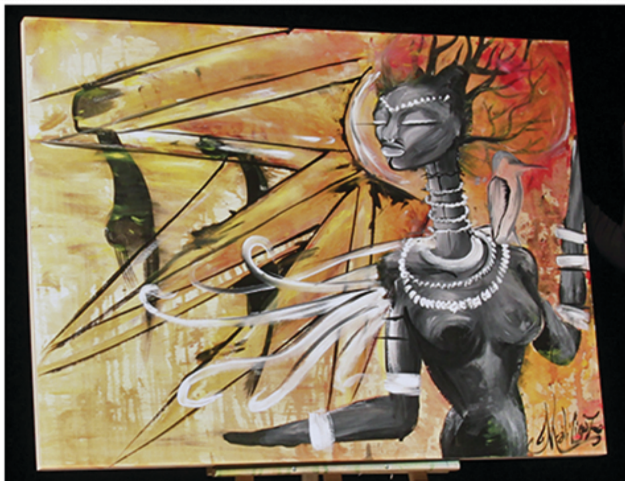
Work by Ma'Liciouz (Live painting at FRO Fest).

BY LISA SPROULL ON FEB 18, 2015 IN ART & DESIGN | COMMENTS OFF